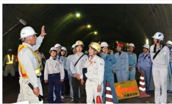
トンネル新築工事を見学

くまもと建麗会として初めての現場見学会は大規模な2号トンネル新築工事現場でした。実際に進行しているトンネル工事の現場を見ることができたのは貴重な経験でした。意見交換会では作業服や女性の働く職場環境などについて一人一人が意見を述べ、有意義な交流ができました。意見交換会でまとめた報告書は(一社)熊本県建設業協会のホームページで公開中です。