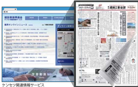
ケンセツ関連情報サービス