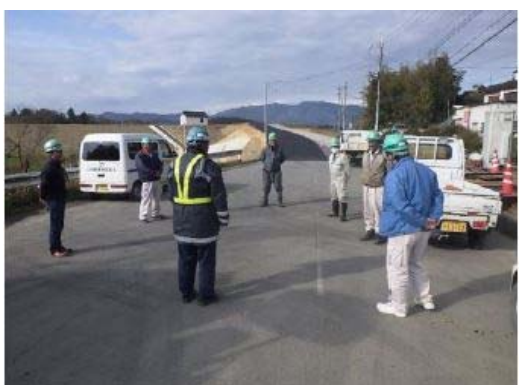
【写真④】朝礼参加人数の縮小