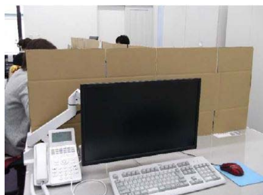
【写真⑤】パーティションによる密接防止