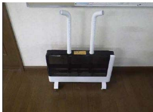
【写真⑥】次亜塩素酸水の使用