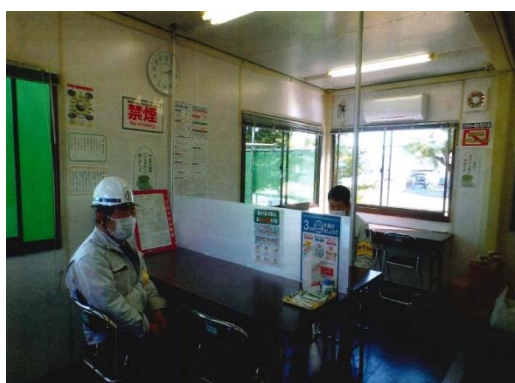
【写真⑤】パーティションによる密接防止