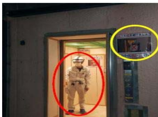
【写真⑤】昇降機の人数制限