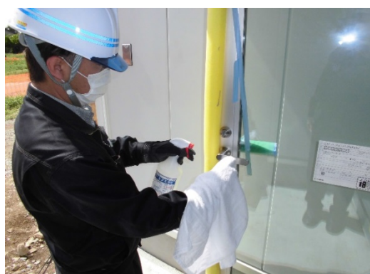
【写真④】ドアノブの消毒