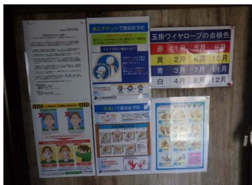
【写真①】ポスター等の掲示

ハンドドライヤーや共有タオルの使用を止め、ペーパータオルまたは個人用タオルを利用する。