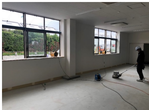
【写真①】送風機による換気(室内側)

機内は「三つの密」になり易い環境にあるため、同乗の回避を励行する。 また、厳守させるためにポスター等を掲示する。