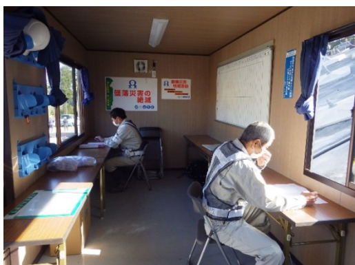
【写真②】対人間隔の確保