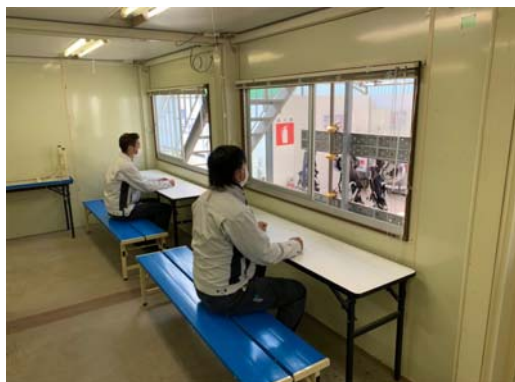
【写真②】休憩室の換気