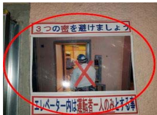
【写真⑥】昇降機利用の注意書き