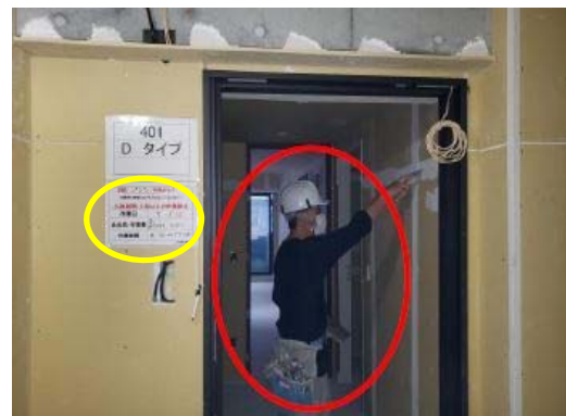
【写真③】室内作業の人数制限