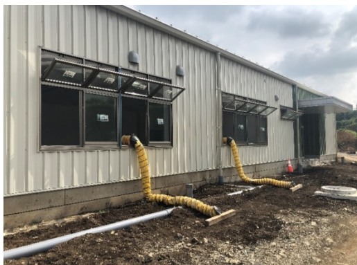
【写真②】送風機による換気(室外側)