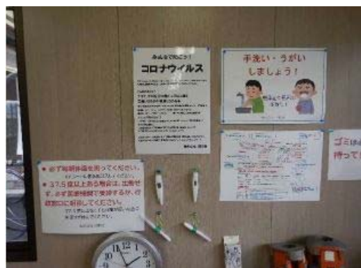
【写真①】ポスター等の掲示

注)似た名前で効果もそっくりな次亜塩素酸ナトリウムは、人体や金属製品などに悪影響を及ぼすので、絶対に加湿器に加えない。