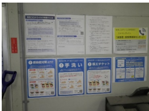
【写真②】ポスター等の掲示2