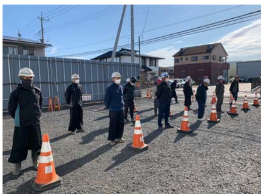
【写真②】配列間隔の確保1