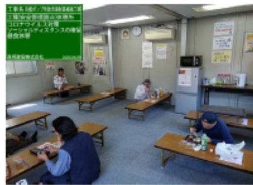
【写真③】対人間隔の確保