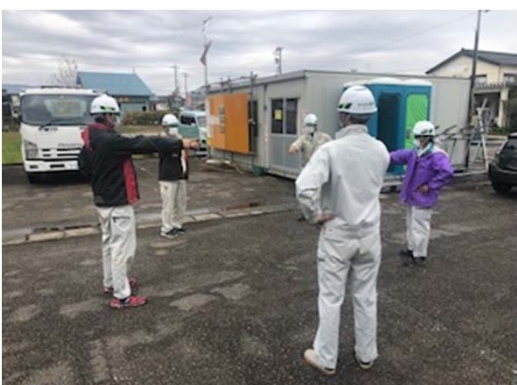
【写真⑤】指差し呼称時の距離の確保