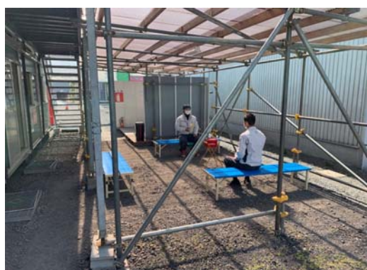
【写真④】休憩場所の工夫