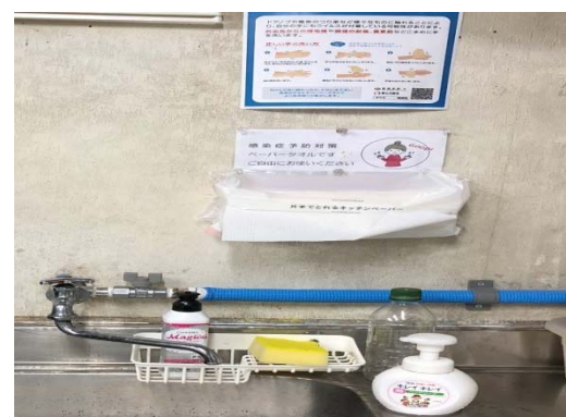
【写真⑥】ペーパータオルの利用