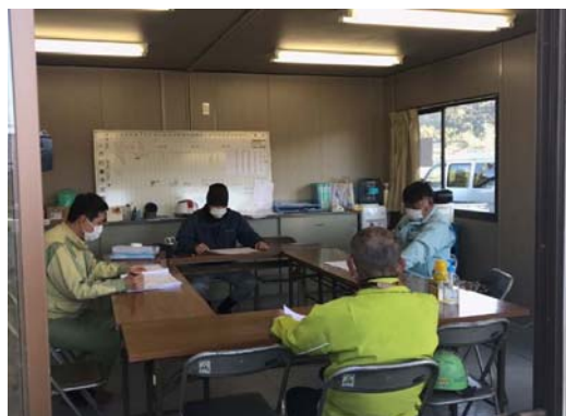
【写真④】対面距離の確保