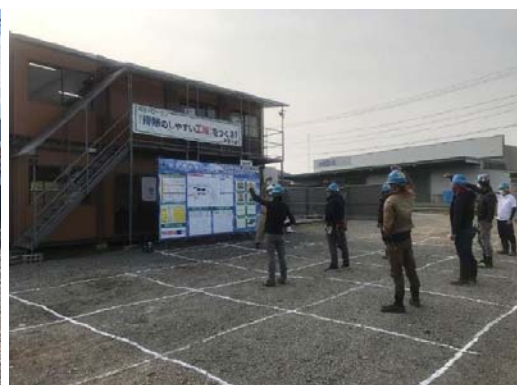
【写真③】配列間隔の確保2