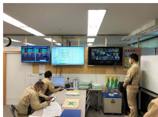
【写真⑥】テレビ電話ツールの利用