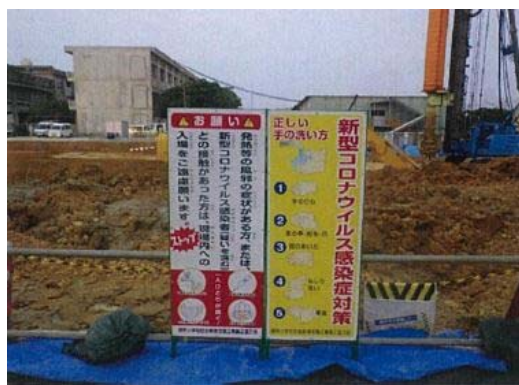
【写真①】ポスター等の掲示1